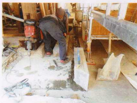
袴腰地覆基礎補修 2018.4.5