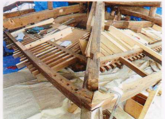
ヒエン垂木・化粧裏板取付 2018.2.9